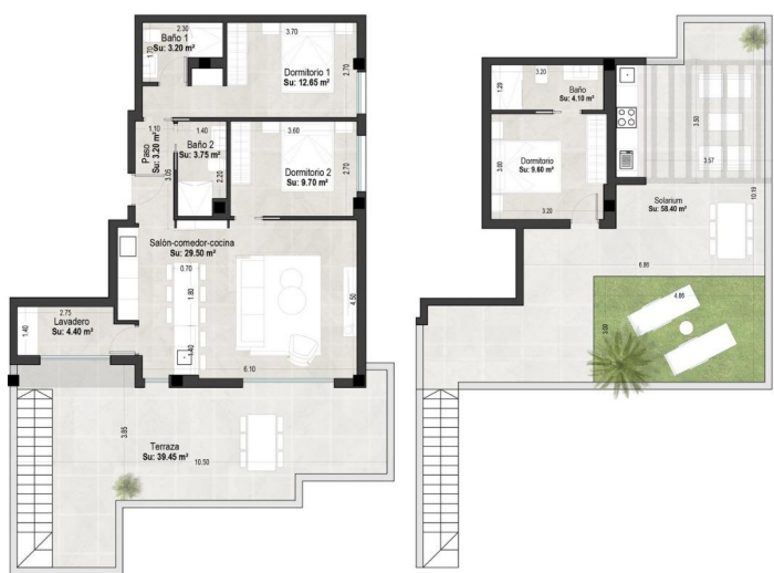
tabla de superficies